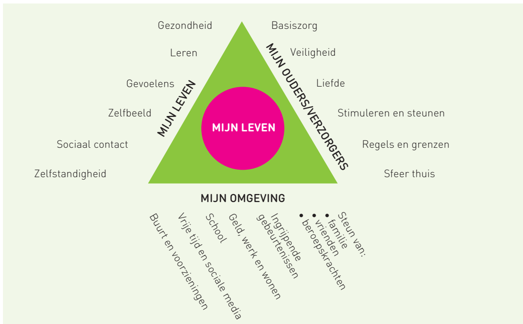
Figuur 1a en 1b CAF-driehoek, bewerking Common Assessment Framework, oktober 2014 Informatie GIZ-driehoek, GGD Holland-Midden, 11-11-2014